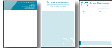
Rezeptformulare mit indiv. Eindruck