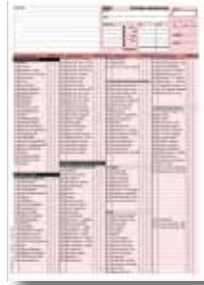
2-seitig Edelmetall, Keramik